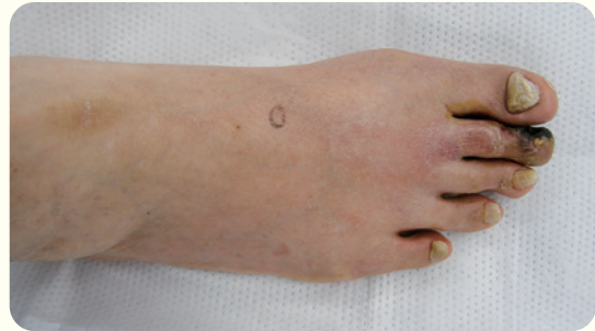
趾の難治性潰瘍。壊疽もみられる。基礎疾患に糖尿病、慢性腎不全（維持透析あり）がある。

血液は、組織活動に必要な酸素や栄養を運搬するため、動脈硬化などで血流が乏しくなると創傷治癒の動きが障害されます。透析を受けている患者さんや末梢閉塞性動脈疾患を